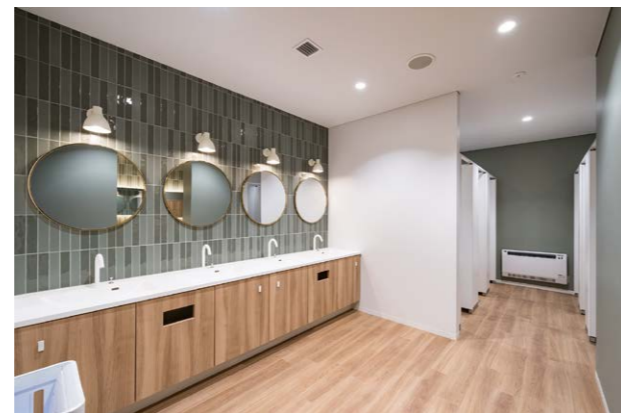
4カ所あるパウダールームはデザインが異なり 選べる楽しさを提供