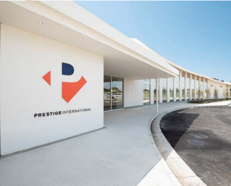
にかほ市内にあった3つのセンターを集約